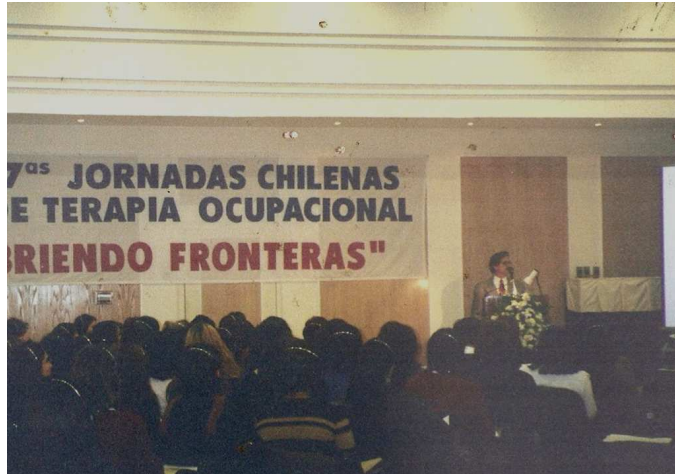
Gary Kielhofner en las 7 as Jornadas Chilenas de Terapia Ocupacional. Año 1998

Su primer libro de 1983, Health Through Occupation (Salud a través de la Ocupación) , dejó entrever la fuerza de su convicción por los valores de la Terapia Ocupacional, sus reflexiones personales que reflejaban la interacción entre la persona, la ocupación y el ambiente, y lo que él llamó "el arte de la terapia ocupacional". Para Gary, el arte de la terapia ocupacional consistía en la gracia de otorgar oportunidades de participación relevantes, con sentido y significancia para la