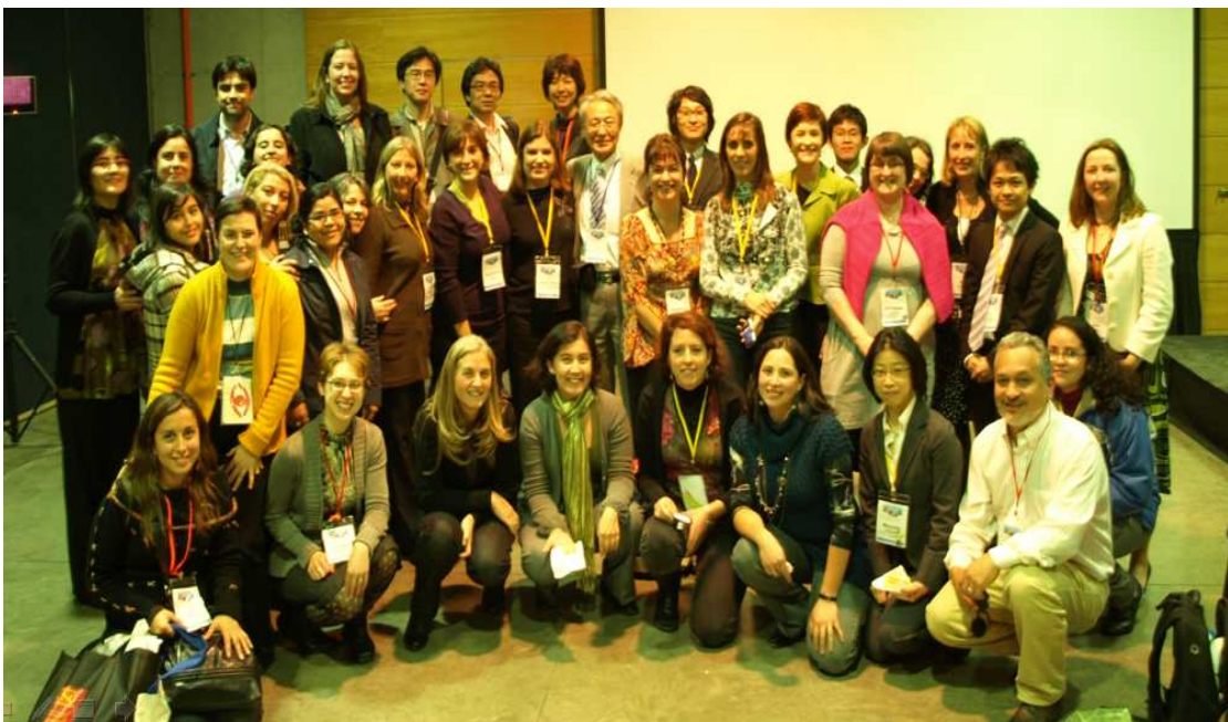
Grupo de trabajo. 30 años del Modelo de Ocupación Humana. Chile. 2010