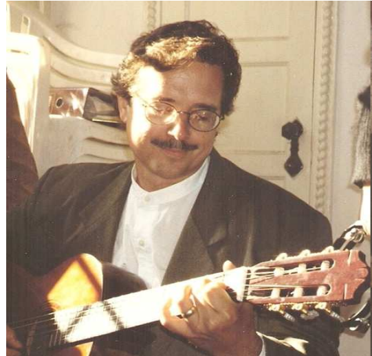
Gary Kielhofner en "Reencuentros". Chile Año 1998

Gary impactó la vida de todos nosotros. Plantó semillas en todos los lugares del mundo que fue y tocó miles de vidas a través de sus libros, artículos publicados, instrumentos y manuales, conferencias, cursos e incluso a través de interacciones informales. Proveyó el fuego a otros para crear por sí mismos, inspirarse, y tomar parte en nuevos desafíos.