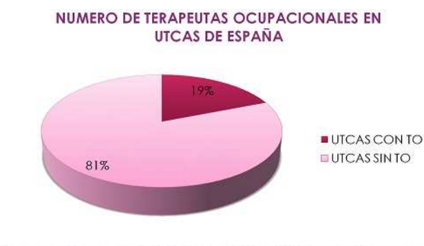
FIGURA 3: representación gráfica número de UTCAS con terapeuta ocupacional (TO) ( rosa oscuro) frente al número de UTCAS sin TO (rosa claro)

Respecto a los 21 hospitales públicos con UTCA obtenidos en las encuestas telefónicas realizadas a los profesionales que trabajaban en las distintas Unidades de Salud Mental, se obtuvo información acerca de los terapeutas que trabajan en estas unidades, obteniendo así