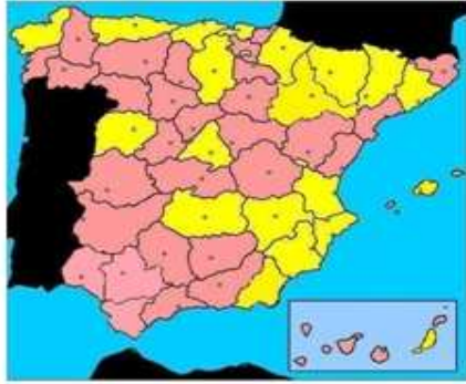
FIGURA 1: representación de las distintas provincias españolas donde existe UTCA( amarillo), y las provincias donde hay ausencia de UTCA( rosa).

normalmente no hay dos unidades en hospitales públicos (exceptuando Madrid).