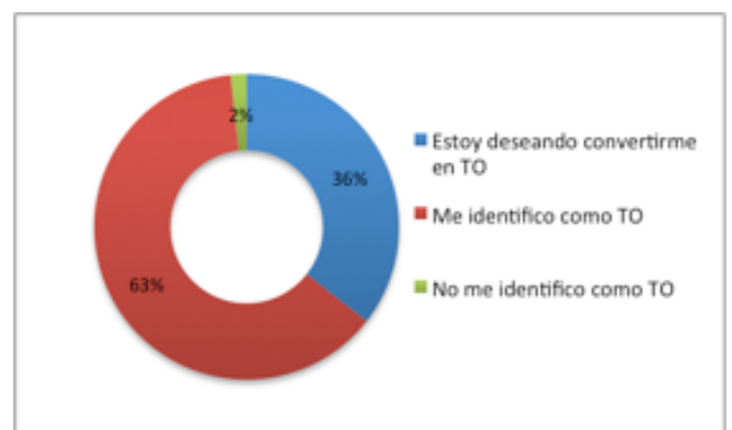
Figura 1. Identificación como terapeuta ocupacional.

Al mismo tiempo, se refieren percibir un gran cambio personal a medida que van estudiando terapia ocupacional: "me he construido como persona de una manera que nunca pensaría que pudiera llegar a ser" (Cuest. 9); "(...) sensación de crecer, adquirir competencias y potenciar otras que estaban más ocultas. Sabía que esta carrera me iba a aportar calidad humana y profesional y así lo he sentido (Cuest. 11). Otro aspecto a destacar es que la mayoría de las y los estudiantes consultados (63%) señalan identificarse como terapeuta ocupacional (ver fig. 1).