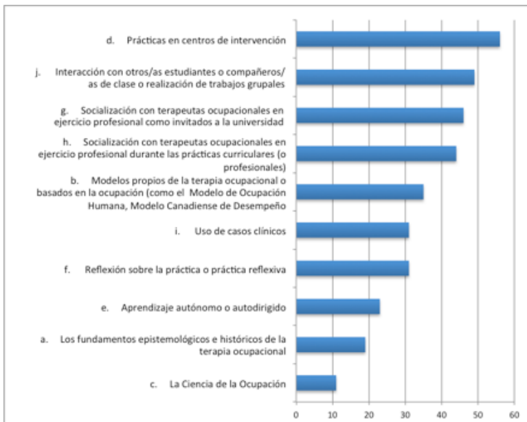
Figura 2 Aspectos de la formación universitaria que han fomentado el desarrollo y mejorado la identidad profesional.

De forma más específica, cuando se pregunta por qué modelos propios de la disciplina son incluidos en la formación profesional, las y los estudiantes señalan que el Modelo de Ocupación Humana (90%), el Modelo Canadiense de Desempeño Ocupacional (83%), el Modelo Kawa (80%), la terapia ocupacional Socio-comunitaria/comunitaria/social (75%) y la teoría/el modelo de Integración sensorial (61%) como los más destacados (ver fig. 3). Respecto a las figuras de identificación un 73% señala identificarse con las y los tutores de práctica; un 51% con los y las profesoras de la universidad y un 47% con sus compañeros/as.